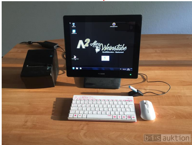
Touch-Screen-Kassensystem für Gastronomie, Bj 2017 Touch-screen-cash register system for restaurants, manuf. 2017