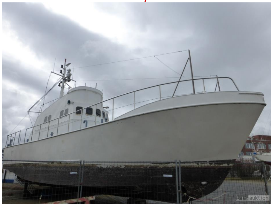
Motoryacht "Preussen", Bj. 1983 Boat "Preussen", made 1983